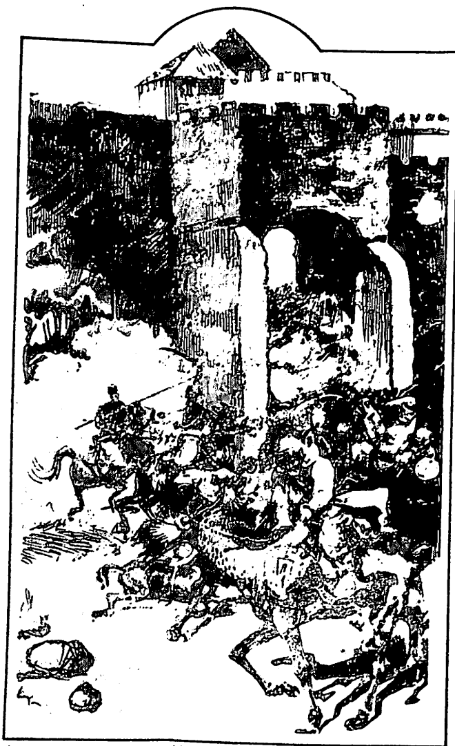
Фрагмент з малюнка М. Самокіши