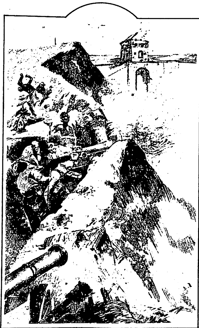
Фрагмент з малюнка М. Самокіна