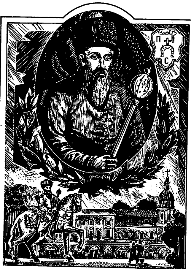
Петро Сагайдачний Гравюра М. Стратілата