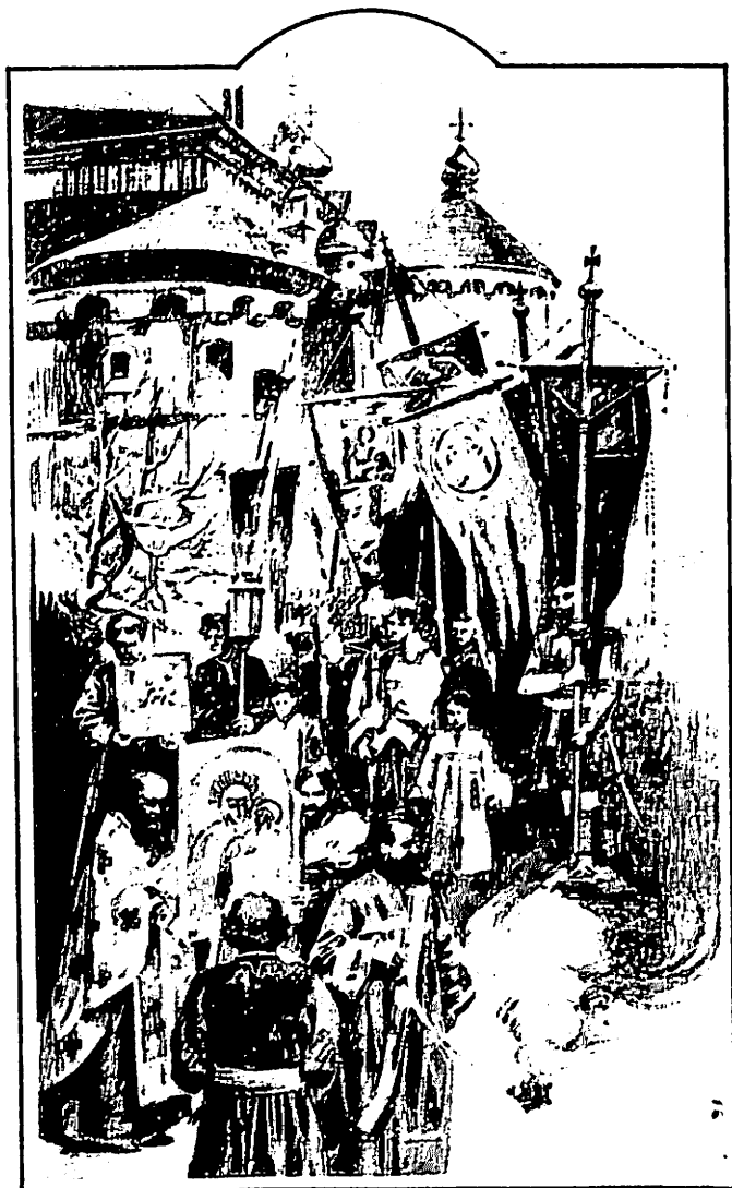
Фрагмент з малюнка М. Самокиша