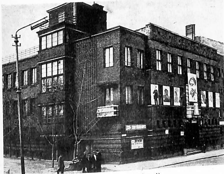
У цьому будинку (Клубна, 1) в травні працював антифашистський конгрес діячів культури

Конгрес гостро засудив фашизм, висунув вимогу про впровадження загального і безплатного навчання в усіх школах, відкрит-