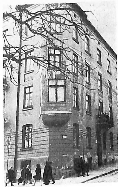
Вул. Магазинова. Будинок 1, де розміщувалася редакція журналу «Вікна»

Велику роль у боротьбі за возз'єднання Західної України з Радянською Україною відіграли революційні письменники С. Тудор, Я. Галан, О. Гаврилюк, П. Козланюк. У травні 1929 р. вони створили організацію «Горно», яка незабаром стала секцією міжнародного бюро революційної літератури в Москві (роботою бюро керували М. Горький, А. Барбюс, Р. Роллан). Органом «Горна» став журнал «Вікна», що виходив з 1927 р. В 1930—1933 рр. редак-