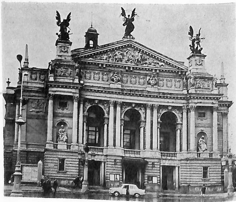
Львівський державний академічний театр опери та балету ім. І. Франка, в якому 26—27 жовтня 1939 р. відбулися Народні Збори Західної України

на Армія перейшла колишній польсько-радянський кордон і подала братню руку допомоги населенню Західної України. 22 жовтня 1939 р. відбулася радісна й врочиста подія — вибори до Народних Зборів Західної України. 26 жовтня повноважні представники народу зібралися у Львівському міському театрі (тепер Державний академічний театр опери та балету імені І. Франка), щоб вирішити долю трудящих Західної України. Депутати Народних Зборів одностайно прийняли Декларації про встановлення Радянської влади в Західній Україні, про входження її до складу Української РСР, проголосили націоналізацію банків і великої промисловості, конфіскацію поміщицьких земель.