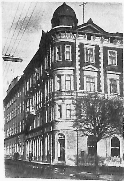
Вул. Валова, 14. У цьому будинку містився Центральний комітет «Сельробу» і редакція газети тієї ж назви

Велику роль у боротьбі за возз'єднання Західної України з Радянською Україною відіграли революційні письменники С. Тудор, Я. Галан, О. Гаврилюк, П. Козланюк. У травні 1929 р. вони створили організацію «Горно», яка незабаром стала секцією міжнародного бюро революційної літератури в Москві (роботою бюро керували М. Горький, А. Барбюс, Р. Роллан). Органом «Горна» став журнал «Вікна», що виходив з 1927 р. В 1930—1933 рр. редак-