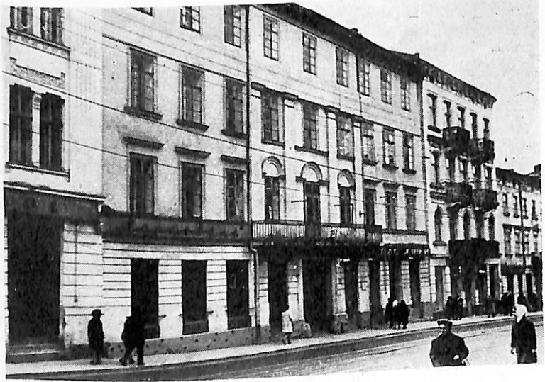
Вул. Леніна. Будинок 22, в якому містилася явочна квартира агентів лєнінської «Искры»

ня обов'язкового навчання рідною мовою і т. п. Збори вирішили всі вимоги скласти в петицію і подати на розгляд Державної ради. Святкування 1 Травня яскраво продемонструвало прагнення робітників до єднання «з мільйонами братів, що борються за свої права, за життя, за світло». До речі, це було перше святкування дня міжнародної солідарності трудящих на території нашої країни. Від того часу робітники Львова відзначали його щорічно.