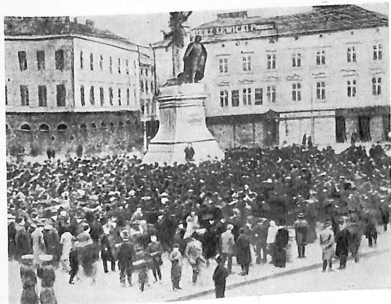
Демонстрація трудящих м. Львова з вимогою загального виборчого права біля пам'ятника А. Міцкевичу (листопад 1905 р.).

В цих умовах уряд оголосив про свій намір запровадити загальне виборче право. Та половинчасті проекти відповідного закону не задовольнили трудящих. Боротьба тривала... Робітничий рух поєднувався з виступами селян.