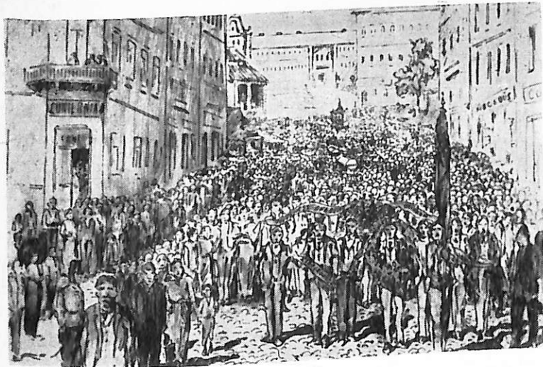
Похорон жертв розстрілу 2 червня 1902 р. Малюнок з газети «Wiek nowy»

Кривавий злочин властей викликав ще більше обурення трудящих. 4 червня у похороні жертв звірячої розправи взяло участь 15 тисяч робітників. Похорон перетворився в демонстрацію про-