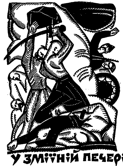
У ЗМІЇНІЙ ПЕЧЕРІ

Буває — доля ворожить шаленим: харциз не схопив Івашка. Несподівано його бахмат трапив ногою в борсучу нору і з розгону беркицьнув на землю — скрутив собі в'язи, придушивши всім тілом господаря.