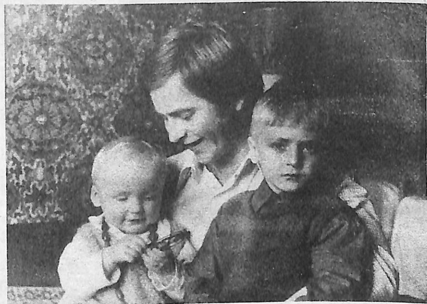
— Ким ви хочете бути, сину мій? — Козакami.