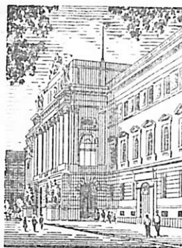
Львів Університет ім. І. Франка