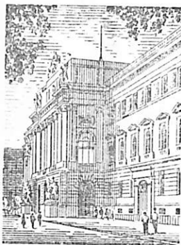
Львів Університет ім. Франка