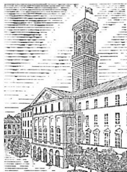
Львів. Будинок міської Ради.