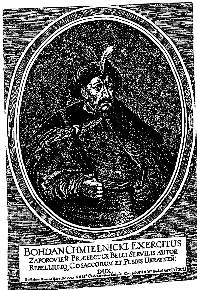
Богдан Хмельницький. Гравюра Батавуса.